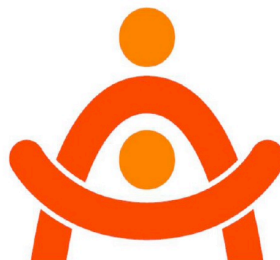
愛知県介護事業所人材育成認証評価事業協賛企業