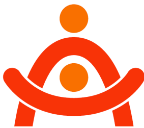
愛知県介護事業所人材育成認証評価事業 令和〇〇年度認証事業所